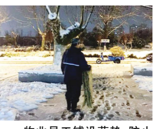
物业员工铺设草垫,防止人员滑倒

此次扫雪铲冰过程中,总务处各部门员工通力合作,冒风雪,顶严寒,通过反复清扫,共同完成校园扫雪工作,确保校园主要校道路、教学区、办公区等重点区域没有积雪结冰,切实保障了师生出行安全。(总务处)