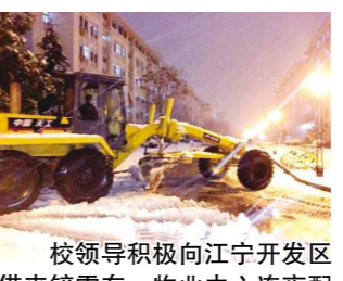
校领导积极向江宁开发区借来铲雪车,物业中心连夜配合对九龙湖校区进行铲雪作业