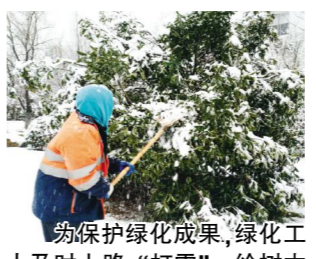
物保护绿化成果,绿化工人及时上路“打雪”,给树木“减负”