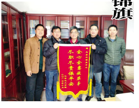
化学化工学院向总务处赠送锦旗

去年暑期的一天,物业中心安保人员在早上6点开门时发现楼上发生火情,通过对火情的判断,他第一时间拨打119电话,在消防人员赶到现场之后,及时告知失火办公室附近存有大量氢气球,事后消防专家称,这给现场救援提供了重要线索,如果采取不当的灭火措施,可能会导致二次爆炸。此事也得到校领导的肯定与表扬。(总务处)