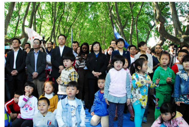
图为幼儿园小朋友们与省市、校领导参与主题活动。