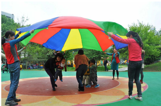
本报讯 4月26日,东南大学幼儿园第八届“欢乐宝贝日”活动顺利举行。

“欢乐宝贝日”活动是面向东南大学“0-3岁”二代教职工子女家庭开展的免费早教服务,已经连续开展了4年。作为省优质幼儿园,东南大学附属幼儿园一直秉承“服务东大二代教职、开拓园内早教思路”的理念和原则,努力向家长们呈现最优质的教育,最贴心的服务,解决教职工的后顾之忧,让他们有更多的时间和精力投身