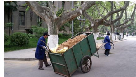
他们仍然坚持在岗位上辛勤的工作,每天仅毛絮就装满3、4辆垃圾车。

为保证校园道路的清洁美观以及避免扬起的毛絮对行人造成影响,环卫组的职工们必须不间断的在道路上清扫,虽然他们戴着口罩,但是每个人还是喷嚏不断,眼睛不时被毛絮迷住,有的人更是引起皮肤过敏,但是